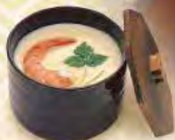
1978年 看板商品 「ジャンボ茶わんむし」誕生